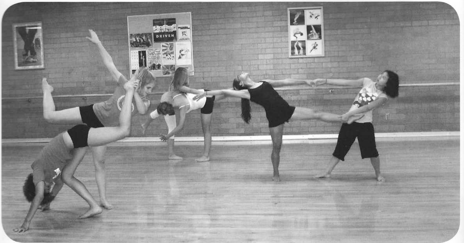
High School Students in the Organization for International Bachelor of Dance Degree